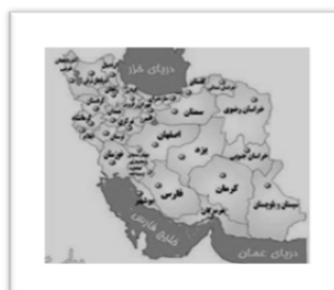
شکل شماره‌ی دو- موقعیت استان اصفهان در ایران