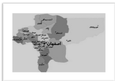
شکل شماره‌ی سه- موقعیت شهرستان آران و بیدگل در استان اصفهان

شهرستان آران و بیدگل از توابع استان اصفهان با وسعت ۶۰۵۱ کیلومتر مربع در پنج کیلومتری شمال کاشان واقع شده است. این شهرستان که در حاشیه‌ی جنوب غربی کویر مرکزی ایران قرار دارد، از شمال به دریاچه‌ی نمک و استان سمنان و قم، از مشرق به شهرستان‌های نطنز و اردستان و از جنوب و غرب به شهرستان کاشان و رشته جبال مرکزی ایران محدود است (سلمانی آرانی، ۱۳۷۷: ۹).