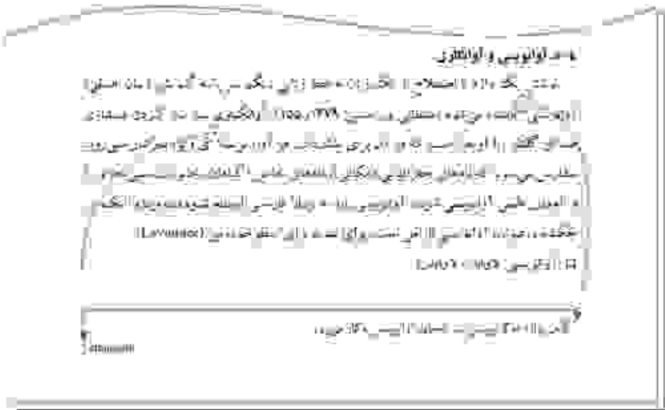
شماره ۱۰۰۰، ۲۰۰۰، ۳۰۰۰، ۴۰۰۰، ۵۰۰۰، ۶۰۰۰، ۷۰۰۰، ۸۰۰۰، ۹۰۰۰، ۱۰۰۰۰