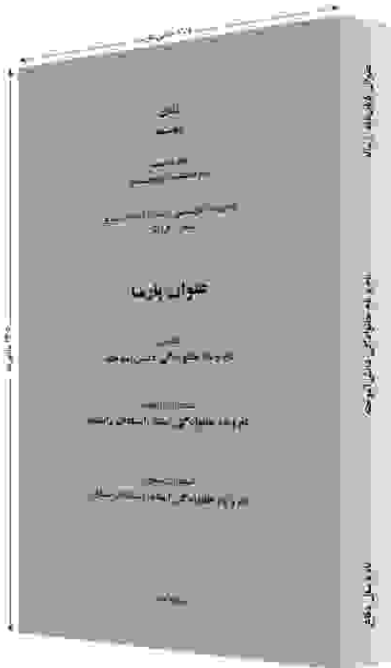
کتاب مقدمه بر مطالعه فقه اسلامی